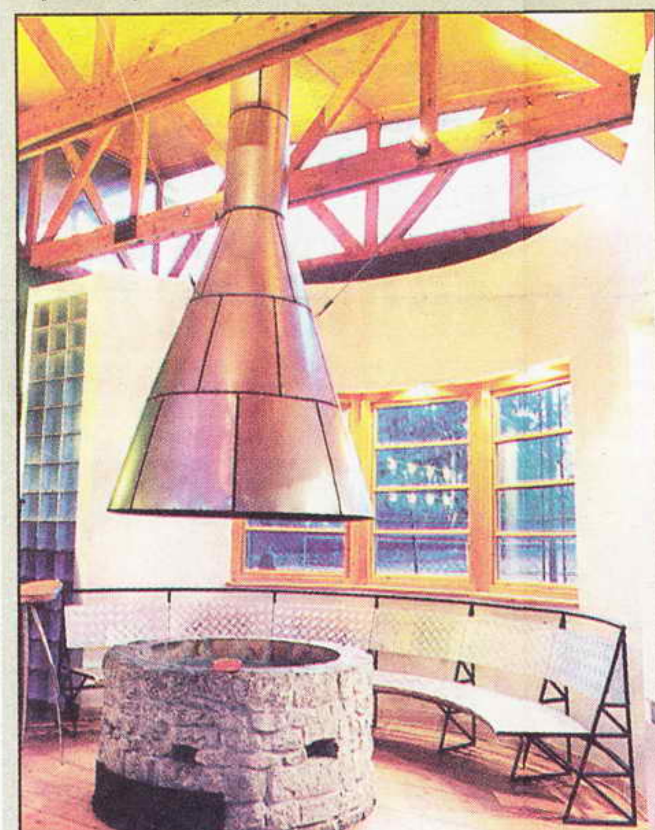
Тениски клуб "Врачар", "Борбина" награда за најбоље реализовано архитектонско дело 1998.

лучких складишта, и биће убудуће посвећена превасходно представљању савременог дизајна и архитектуре.