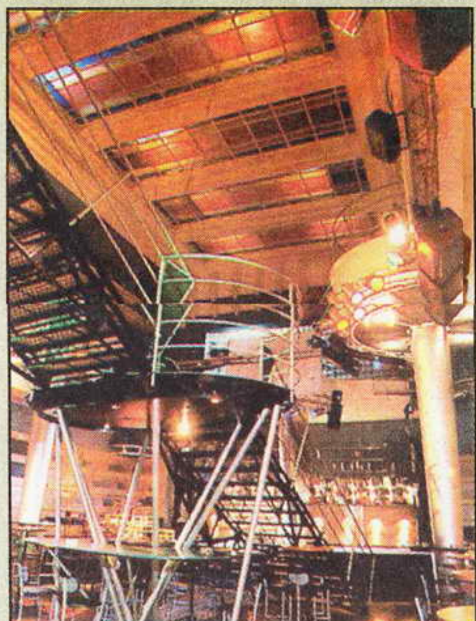
Ноћни клуб "XL" - адаптација, ентеријер и мобилијар, награда фонда "Александар Шалетић", 1997.