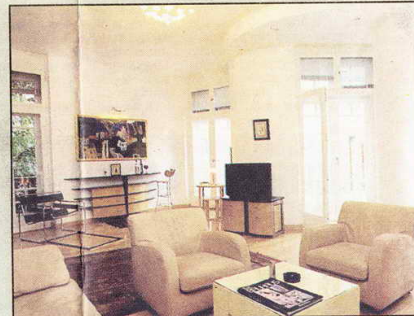
Вила "С", Велика награда за архитектуру 2001.