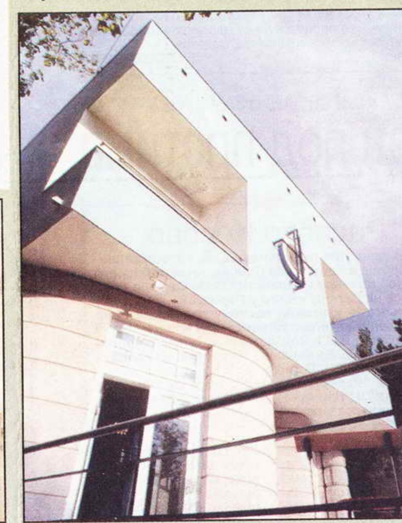
Вила "С", Велика награда за архитектуру 2001.

Најбоља потврда угледа је одзив на конкурс и живо интересовање из иностранства (некадашњих република бивше Југославије) за резултате конкурса, као и заинтересованост за изложбу.