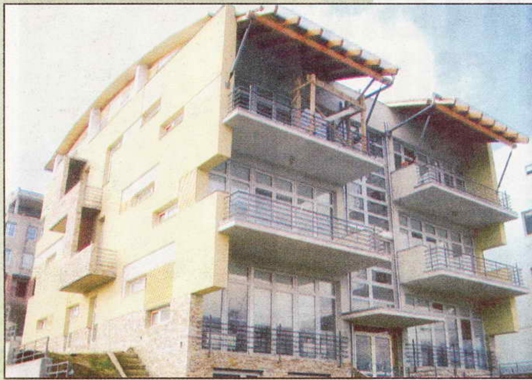
Мусићево дело, корак напред у нашем градитељству